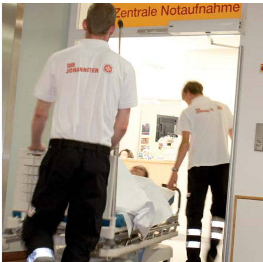
Ankunft im Notfallzentrum in der Prüfeninger Straße.