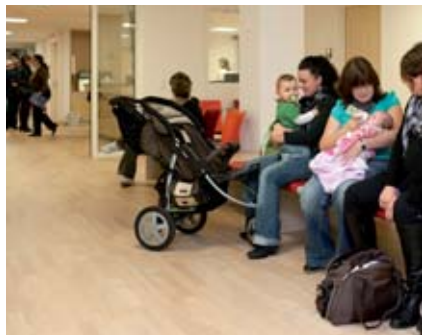
Wartebereich im KUNO Kinder-Notfallzentrum.