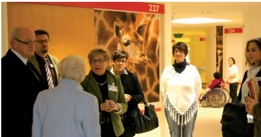
Führung über die neugestalteten Stationen.