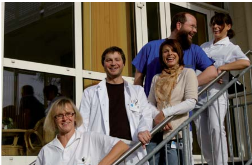
Ein guter Zusammenhalt im Team ist für die Arbeit auf der Palliativstation von enormer Bedeutung.