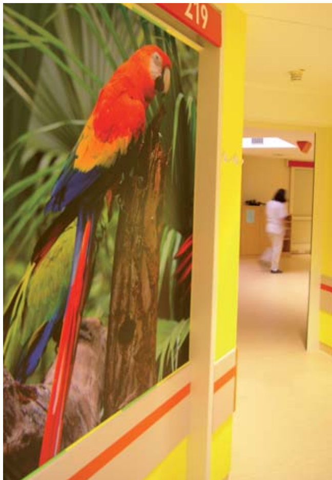
Großformatige Dschungel- und Afrikamotive nehmen Kinder und Jugendliche der Hedwigsklinik mit auf eine Abenteuerreise.