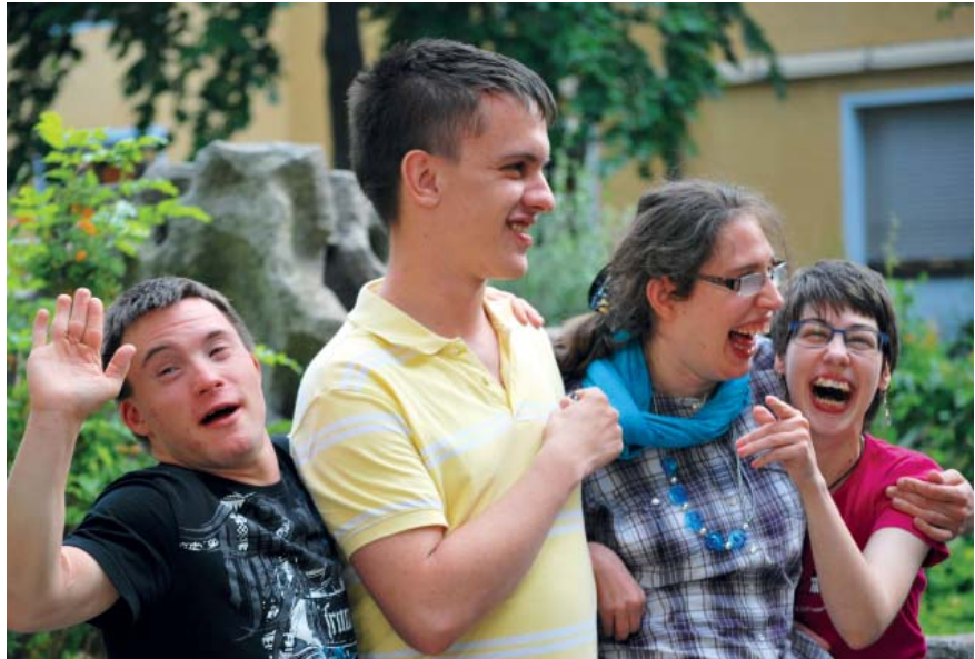
Gute Laune zum großen Fest auf dem Klosterberg