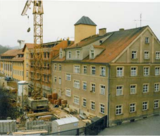
Baustelle Reichenbach 1984

der Johann von Gott-Werkstatt erhalten. Zusammen mit den Mitarbeitenden standen auch Arbeiten in Küche, Wäscherei, Metzgerei oder Schusterei auf dem täglichen Programm.