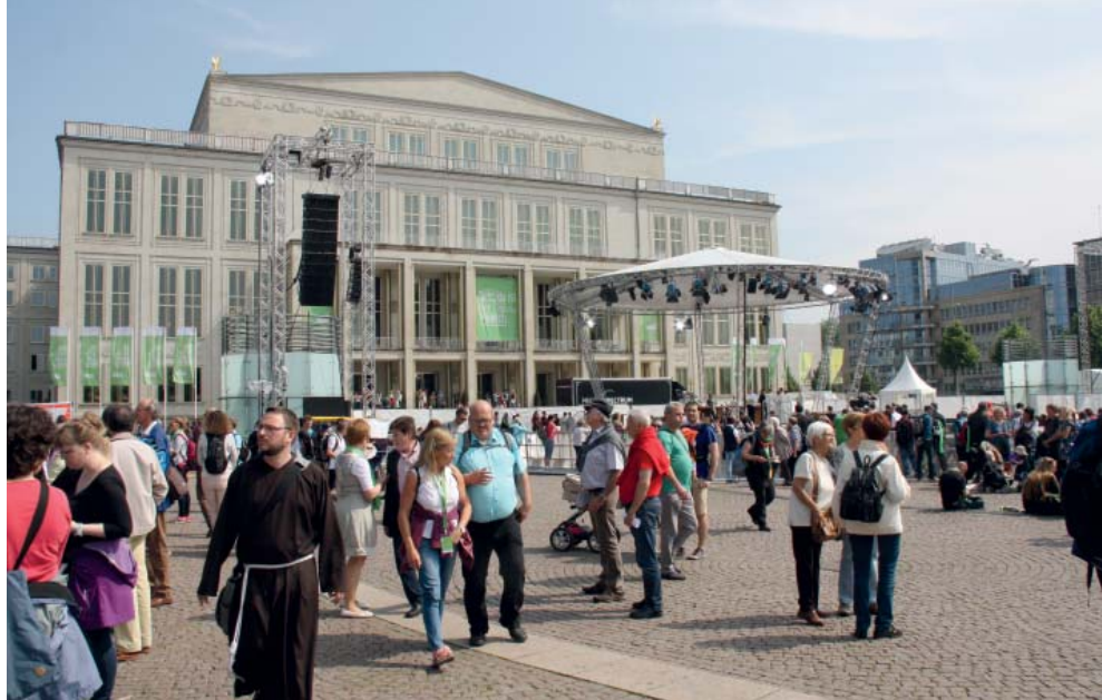
Auch an der zentral gelegenen Oper in Leipzig zeigt der Katholikentag Präsenz.