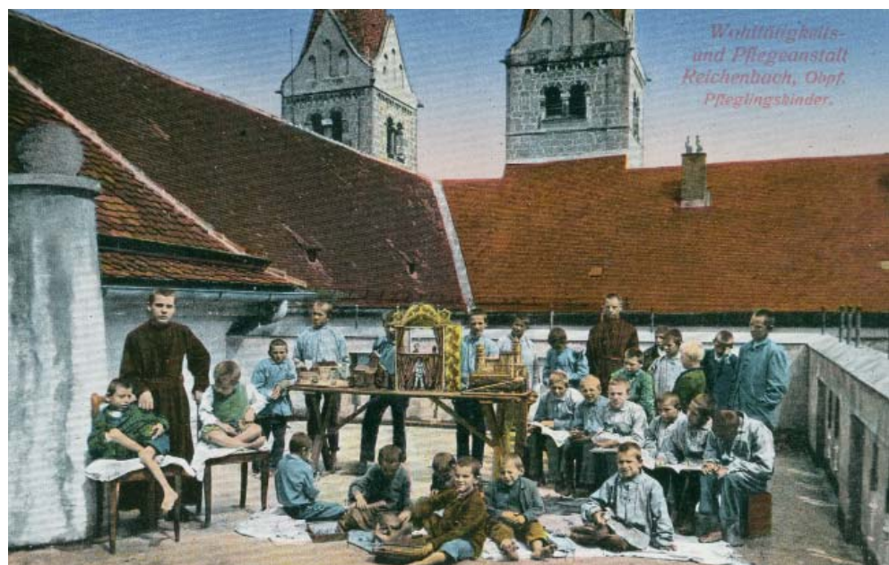
Postkarte von 1911 mit jugendlichen „Pfleglingen“ auf der Dachterrasse

Von den 1970er bis 90er Jahren setzte ein weiterer Wandel auf dem Klosterberg ein. Die Barmherzigen Brüder ließen Gebäude sanieren, Neubauten für Wohngruppen und Arbeitsplätze entstanden. In Schreinerei, Weberei und Korbflechterei fanden die Bewohner Arbeit. Bis heute haben sich die Aufträge für die Industrie als wichtiger Zweig in