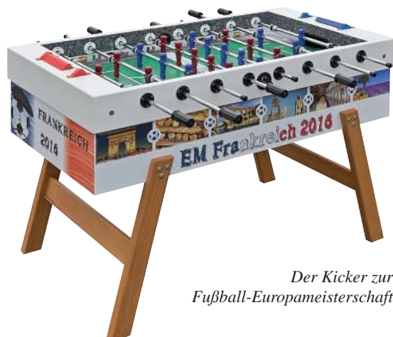
Der Kicker zur Fußball-Europameisterschaft