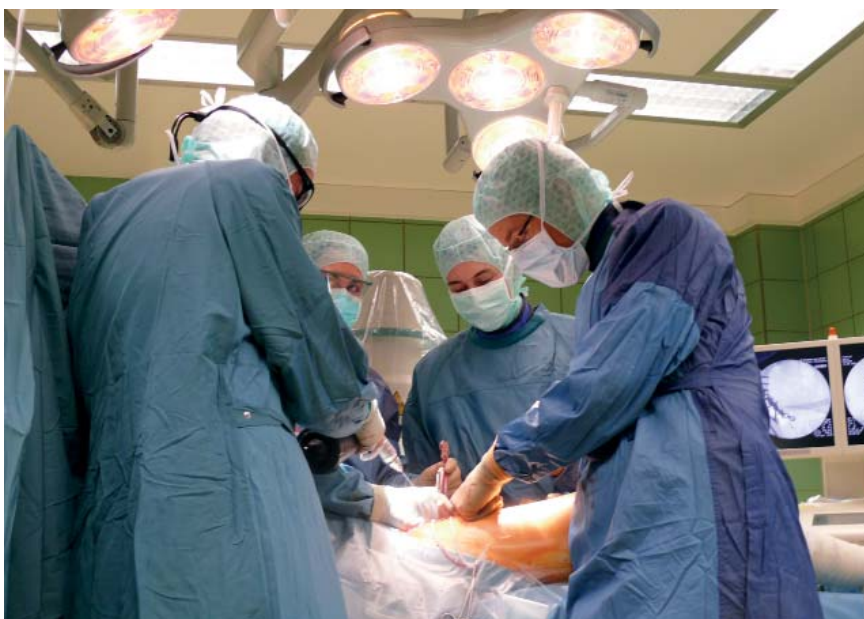
Konzentrierte gemeinsame Arbeit im OP

Menschliche Nähe ist im kollegialen Miteinander unverzichtbar. Idealerweise sollte sie auf freundschaftlicher Basis stattfinden. Auch die Nähe zu Vorgesetzten ist bedeutsam für Vertrauen und Geborgenheit. Andererseits gibt es auch ein Zuviel: Nähe bedeutet nicht Distanzlosigkeit oder gar Missachtung der Privatsphäre. Dies gilt insbesondere für das Verhältnis von Vorgesetzten zu Mitarbeitern.