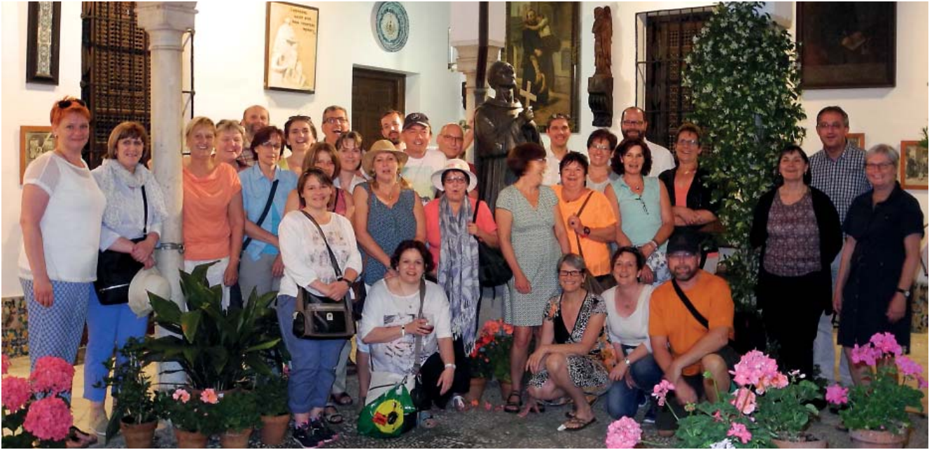
Gruppenbild im Innenhof der Casa de los Pisa, dem Haus, in dem Johannes von Gott gestorben ist, heute als Museum dem Heiligen gewidmet.