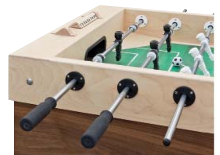
Kicker in Naturholz-Ausführung

cker nach den individuellen Wünschen der Kunden gefertigt. Werbebanden und Außenflächen können zum Beispiel mit einem Firmenlogo gestaltet werden, die Spielfläche als „Hallenboden“ oder „Rasen“. Schulen und Jugendeinrichtungen lassen sich oft durch den Verkauf von Werbeflächen ihren Kicker finanzieren. Die Kinder und Jugendlichen können in den Pausen angestaute Energie abbauen und Teamgeist entwickeln.